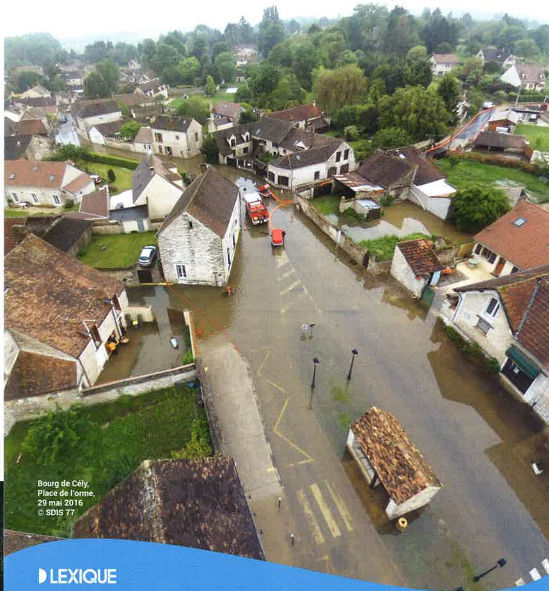
Bourg de Cely, Place de l'orme, 29 mai 2016