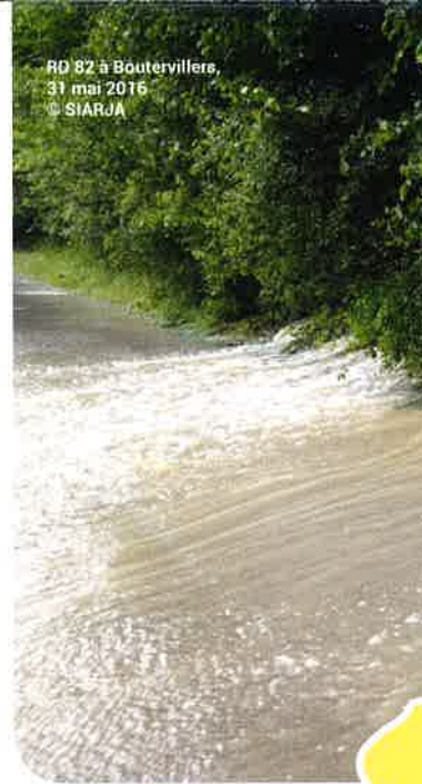
RD 82 à Boutervillers, 31 mai 2016

L'Agence de l'Eau Seine-Normandie, les Conseils départementaux, l'EPTB Seine Grands Lacs pour l'École-Rebais et les services de l'État (DDT et DRIEAT) sont les partenaires financiers de ces modélisations.